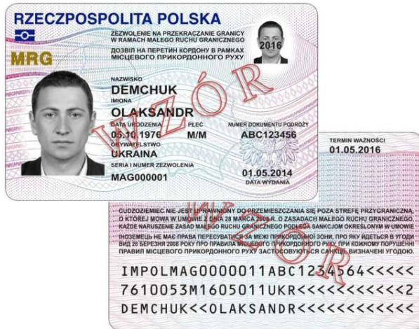
Wzór zezwoleń na przekraczanie granicy w ramach MRG.

Mieszkańcy strefy przygranicznej mogą przekraczać granicę polsko - ukraińską w ramach małego ruchu granicznego pod warunkiem, że: