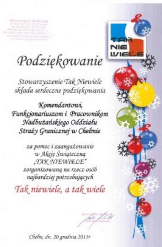
Podziękowania Stowarzyszenia Tak Niewiele