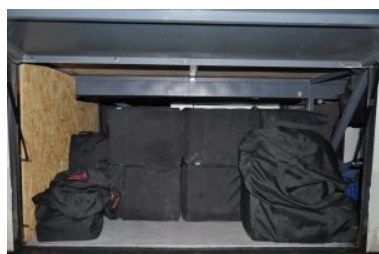
Ujawnione nielegalne papierosy

W dniu 15 stycznia br., podczas kontroli drogowej prowadzonej w m. Stary Zamość w pow. zamojskim, funkcjonariusze z Grupy Zamiejscowej w Zamościu Placówki SG w Lublinie oraz Placówki SG w Hrebennem, zatrzymali do kontroli drogowej autobus rejsowy do woj. pomorskiego. Okazało się, iż funkcjonariusze trafnie wytypowali ten pojazd do kontroli. W trakcie prowadzonych czynności funkcjonariusze ujawnili bowiem w przestrzeni bagażowej autobusu, wyroby tytoniowe bez polskich znaków skarbowych akcyzy w postaci papierosów różnych marek o szacunkowej wartości ponad 120 tys. zł.