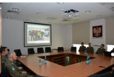
Funkcjonariusze NOSG powrócili z misji w Macedonii #5