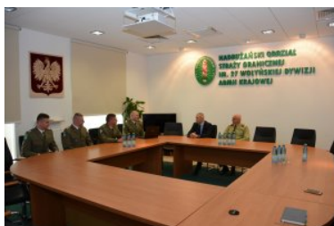
Funkcjonariusze NOSG powrócili z misji w Macedonii #4

Zgodnie z protokołem w sprawie wspólnej operacji Straży Granicznej z Policją Republiki Macedonii, 30 funkcjonariuszy SG wyposażonych w broń służbową z amunicją, podstawowe środki przymusu bezpośredniego i inny specjalistyczny przenośny sprzęt do ochrony granicy oraz pojazdy służbowe Straży Granicznej udało się do Macedonii na kolejną, czwartą już misję wsparcia. W ramach misji funkcjonariusze SG wspierali macedońską policję w zadaniach związanych z: rejestracją wniosków o udzielenie ochrony międzynarodowej, badaniem autentyczności dokumentów i zapobieganiem nielegalnemu przekroczeniu granicy poza przejściami granicznymi.