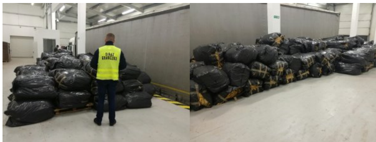
Ujawniony nielegalny tytoń