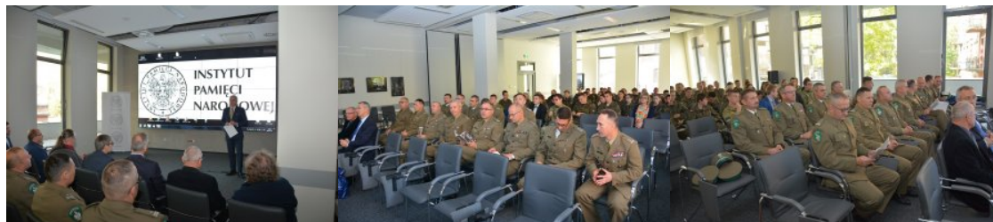
Otwarcie wystawy "Korpus Ochrony Pogranicza 1924-1939"

17 października br., odbyło się otwarcie wystawy „Korpus Ochrony Pogranicza 1924-1939” zorganizowane przez Oddziałowe Biuro Edukacji IPN w Lublinie. Wydarzenie rozpoczęło się o godz. 12.00 w sali konferencyjnej lubelskiego Instytutu Pamięi Narodowej przy ul. Wodopojnej 2, w której uczestniczyli przedstawiciele władz samorządowych, Nadbużańskiego Oddziału Straży Granicznej oraz młodzież ze szkół średnich z klas mundurowych.