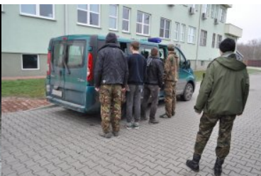
Ośmiu przemytników zatrzymanych na gorącym uczynku

W przedmiotowej sprawie zostało wszczęte postępowanie przygotowawcze. Zatrzymani ob. Ukrainy odpowiadają za nielegalne przekroczenie granicy państwowej. Po zakończeniu wobec nich czynności prowadzonych przez SG, zostali oni przekazani ukraińskim służbom granicznym.