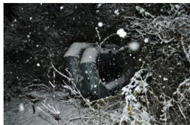
Ośmiu przemytników zatrzymanych na gorącym uczynku

21 listopada br. we wczesnych godzinach porannych, funkcjonariusze z Placówki SG w Skryhiczynie, podczas prowadzonych działań w rejonie granicy państwa w pow. chełmskim, zauważyli osoby, które znajdowały się w pobliżu rzeki granicznej Bug. W wyniku kontroli tych osób, ustalono, iż są to ob. Ukrainy, którzy przy pomocy dwóch łodzi pontonowych nielegalnie przekroczyli granicę państwa w celu przemytu papierosów. W sumie na terytorium Polski, zatrzymano 8 mężczyzn w wieku od 18 do 36 lat. Do przemytu papierosów nie doszło a zatrzymani ob. Ukrainy, zostali przewiezieni do pomieszczeń służbowych Placówki SG w Dorohusku.