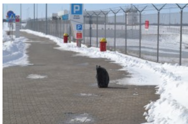
Mandat za pozostawiony bagaż

W wyniku rozpytania świadków zdarzenia oraz podania komunikatów o pozostawionym bagażu nie ustalono właściciela torby podróżnej. W miejscu pozostawionego bagażu została wygrodzona strefa bezpieczeństwa. W dalszej kolejności podjęto działania związane z rozpoznaniem bagażu z wykorzystaniem robota pirotechnicznego IBIS oraz prześwietlarki rentgenowskiej.