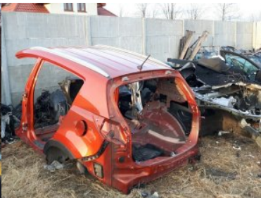
Odzyskano samochody i części samochodowe