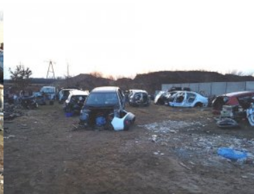
Odzyskano samochody i części samochodowe

Funkcjonariusze zatrzymali właściciela posesji. 37-latek trafił do policyjnej celi. Zebrany materiał dowodowy, już na tym etapie, pozwolił policjantom wydziału dochodzeniowo - śledczego wołomińskiej Komendy na przedstawienie Łukaszowi K. zarzutów paserstwa, za co może mu grozić kara nawet do 5 lat pozbawienia wolności.