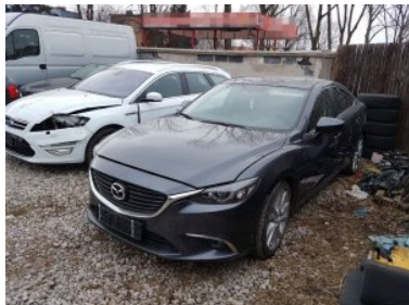
Odzyskano samochody i części samochodowe

wyposażenia pojazdów posiadające numery nadające się do identyfikacji między innymi: 21 sterowników elektronicznych, poduszki powietrzne oraz silnik i skrzynia biegów pochodzące głównie z samochodów japońskich a także samochodowe radio z forda. Karoseria kia i wszystkie te elementy zostały zabezpieczone przez kryminalnych.