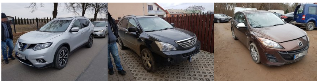
Odzyskano samochody i części samochodowe

Kryminalni wołomińskiej Komendy oraz funkcjonariusze NOSG z Placówki Straży Granicznej z Terespoła przeprowadzili w ubiegłym tygodniu na terenie powiatu wołomińskiego wspólne działania ukierunkowane na zwalczanie przestępczości samochodowej. Informacje jakie posiadali funkcjonariusze wskazywały, że na prywatnej posesji w Jadowie mogą znajdować części i pojazdy pochodzące z kradzieży. Mundurowi udali się pod wskazany adres. Podczas kontroli znajdujących się na posesji pociętych karoserii samochodowych, funkcjonariusze ujawnili, że pola numerowe nadwozi zostały usunięte. Już wstępne czynności wskazały, że mogą one pochodzić z kradzieży.