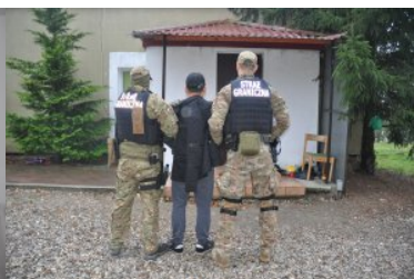
Zatrzymania realizowane przez funkcjonariuszy NOSG