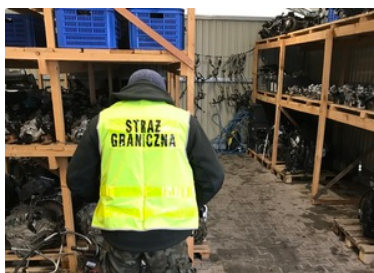
Zabezpieczanie części samochodowych

Funkcjonariusze wpadli na trop mężczyzny, który trudnił się nielegalnym procederem, po tym jak zatrzymali oni na drogowym przejściu granicznym w Hrebennem, części samochodowe pochodzące z kradzieży. Z informacji funkcjonariuszy wynikało, że 41-letni właściciel firmy oferującej części samochodowe, handlował kradzionym towarem zarówno stacjonarnie, jak i za pośrednictwem portali internetowych. We wtorek, kryminalni wraz z funkcjonariuszami Placówki Straży Granicznej w Hrebennem przeprowadzili kontrolę działającej w Knurowie firmy. W magazynowych namiotach odkryli kilkadziesiąt ułożonych na paletach i przygotowanych do sprzedaży części. Funkcjonariusze przechwycili samochodowe silniki, skrzynie biegów oraz elementy karoserii.