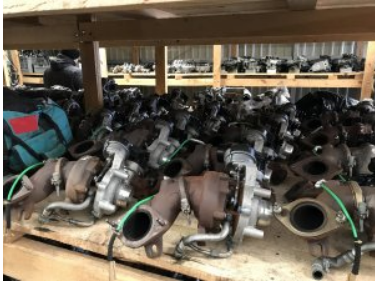
Zabezpieczanie części samochodowych

Łączna wartość kradzionych przedmiotów wstępnie została oszacowana na 370 tysięcy złotych. Niewykluczone jednak, że kwota ta okaże się znacznie wyższa. 41-letniemu właścicielowi firmy grozi nawet 5 lat więzienia.