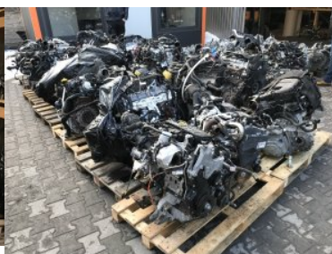
Zabezpieczanie części samochodowych