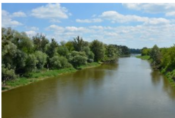
Zaangażowanie NOSG w projekty PL-BY-UA 2014-2020

Głównym celem każdego z projektów jest wzmocnienie ochrony granicy państwowej, zapobieganie i zwalczanie nielegalnej migracji, handlu ludźmi oraz walka ze zorganizowaną przestępczością transgraniczną poprzez rozbudowę systemów nadzoru, która wpłynie na poprawę efektywności odpraw granicznych.