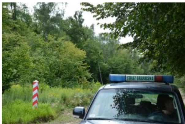
Zaangażowanie NOSG w projekty PL-BY-UA 2014-2020

W chwili obecnej zostały podpisane umowy grantowa i partnerska, dokonano wyboru audytora oraz ogłoszono przetargi.