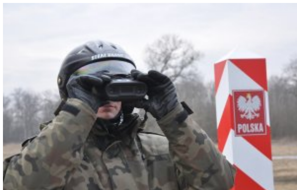
Zaangażowanie NOSG w projekty PL-BY-UA 2014-2020

Trzeci projekt PBU1/0239/16 Poprawa systemu nadzoru granicy Polsko-Ukraińskiej – Segment Centralny, którego liderem została Administracja PSGU a pozostałymi beneficjentami Lwowski Oddział PSGU, Nadbużański Oddział SG, Bieszczadzki Oddział SG, Komenda Główna SG.