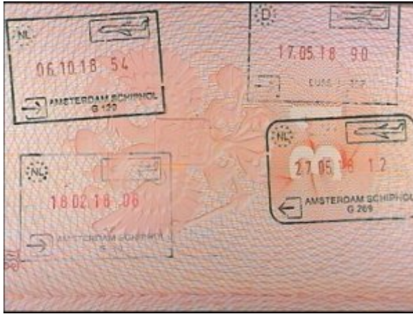
Fałszywe odbitki stempli