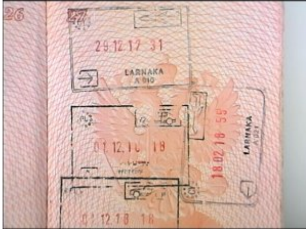
Fałszywe odbitki stempli

Funkcjonariusze z Nadbużańskiego Oddziału Straży Granicznej, w swej codziennej służbie, podczas prowadzonych kontroli granicznych, ujawnili w tym roku ponad 260 fałszerstw różnych dokumentów przedstawianych do kontroli. Najczęściej fałszowane są: „Oświadczenia o zamiarze powierzenia pracy.....”, paszporty, wize, dowody rejestracyjne pojazdów, polisy ubezpieczeniowe, zezwolenia na pobyt oraz prawa jazdy.