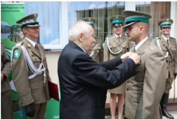
Pułkownik Kazimierz Bąbiński patronem Placówki NOSG w Lublinie