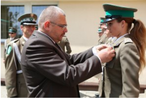
Pułkownik Kazimierz Bąbiński patronem Placówki NOSG w Lublinie