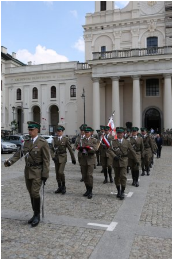
Pułkownik Kazimierz Bąbiński patronem Placówki NOSG w Lublinie