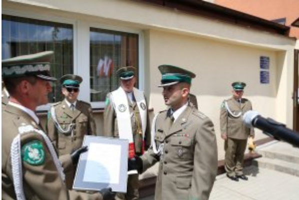
Pułkownik Kazimierz Bąbiński patronem Placówki NOSG w Lublinie