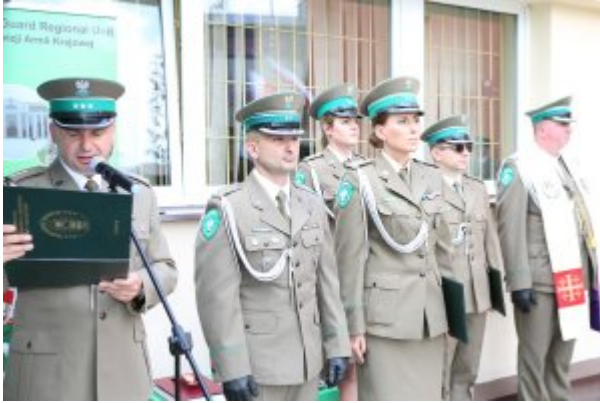
Pułkownik Kazimierz Bąbiński patronem Placówki NOSG w Lublinie