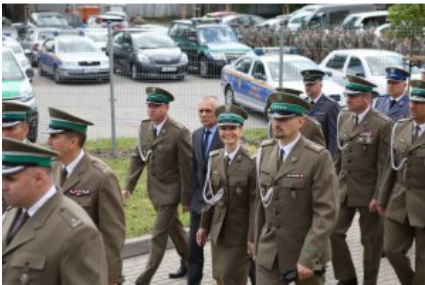
Pułkownik Kazimierz Bąbiński patronem Placówki NOSG w Lublinie