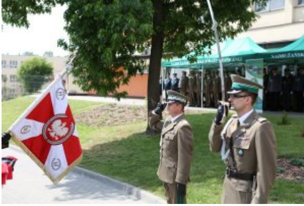
Pułkownik Kazimierz Bąbiński patronem Placówki NOSG w Lublinie