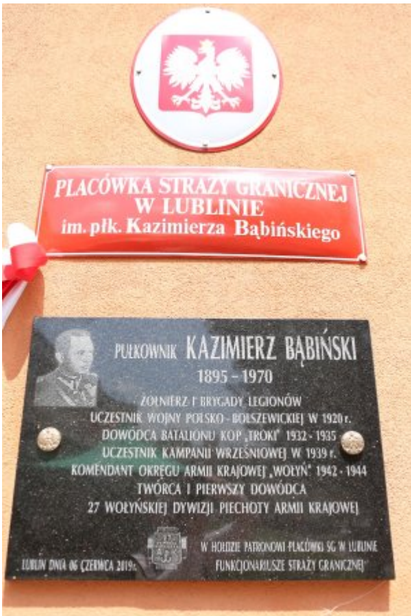
Pułkownik Kazimierz Bąbiński patronem Placówki NOSG w Lublinie