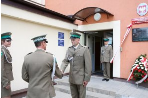
Pułkownik Kazimierz Bąbiński patronem Placówki NOSG w Lublinie