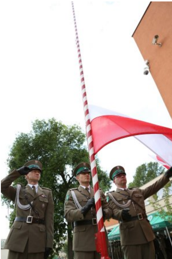
Pułkownik Kazimierz Bąbiński patronem Placówki NOSG w Lublinie