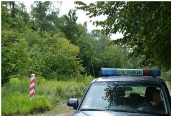
Zaangażowanie NOSG w projekty PL-BY-UA 2014-2020

A grant agreement and a partnership agreement were signed, an auditor was selected and tenders were announced.