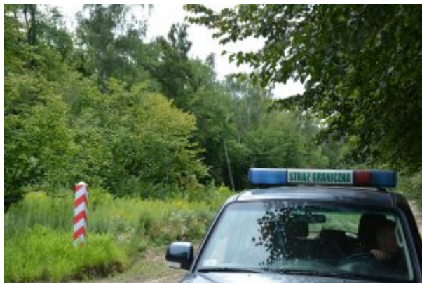
Zaangażowanie NOSG w projekty PL-BY-UA 2014-2020

W chwili obecnej zostały podpisane umowy grantowa i partnerska, dokonano wyboru audytora oraz ogłoszono przetargi.