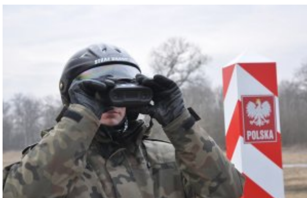
Zaangażowanie NOSG w projekty PL-BY-UA 2014-2020

A grant agreement and a partnership agreement were signed, an auditor was selected and approved by the National Contact Point at the Center of European Projects. Tenders were announced, as well.