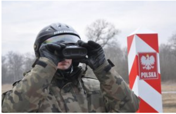
Zaangażowanie NOSG w projekty PL-BY-UA 2014-2020

Trzeci projekt PBU1/0239/16 Poprawa systemu nadzoru granicy Polsko-Ukraińskiej – Segment Centralny, którego liderem została Administracja PSGU a pozostałymi beneficjentami Lwowski Oddział PSGU, Nadbużański Oddział SG, Bieszczadzki Oddział SG, Komenda Główna SG.