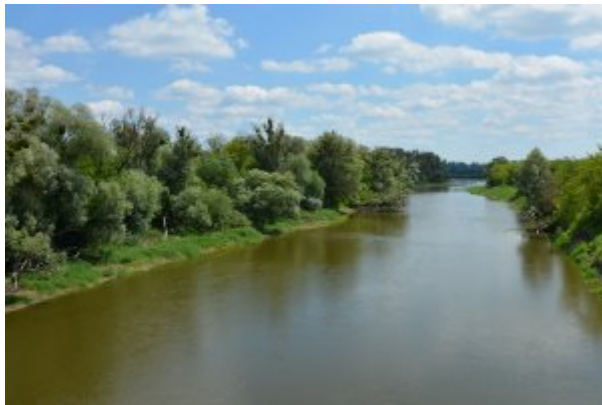
Zaangażowanie NOSG w projekty PL-BY-UA 2014-2020

The main goal of each project is to strengthen state border protection, prevent and combat illegal migration, human trafficking and the fight against organized cross-border crime by developing surveillance systems. It will improve the efficiency of border checks.