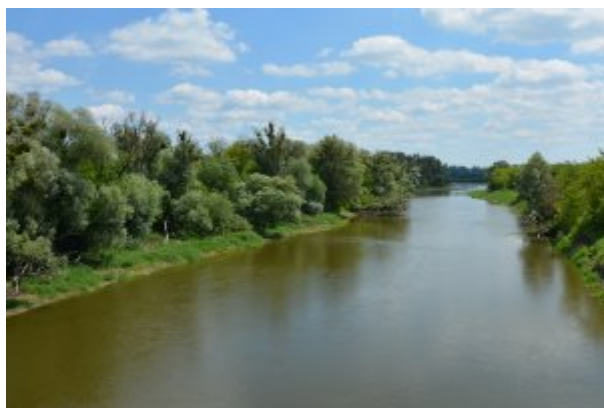
Zaangażowanie NOSG w projekty PL-BY-UA 2014-2020

W ramach realizowanego projektu, dla Nadbużańskiego Oddziału SG, zostanie zakupionych 16 kompletów przenośnych kamer termowizyjnych, 1 zestaw inteligentnego termowizyjnego systemu monitorowania obszaru przyległego do przejścia granicznego w Hrebennem, szczególnie narażonego na przestępczość transgraniczną związaną z nielegalną migracją oraz 5 zestawów systemów umożliwiających komunikację radiową na obszarach poza zasięgiem systemu cyfrowego DMR za pośrednictwem sieci GSM.