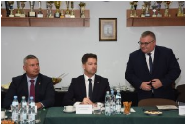
Wizyta Wiceministra MSWiA w Nadbużańskim OSG