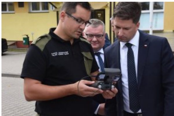
Wizyta Wiceministra SWiA w Nadbużańskim OSG