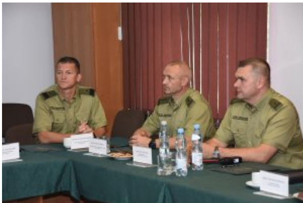
Wizyta Wiceministra MSWiA w Nadbużańskim OSG

Proponowane przez Unię Europejską zmiany dotyczą wdrożenia Systemu Wjazdu/Wyjazdu (EES) i Europejskiego Systemu Informacji o Podróżach oraz Zezwoleń na Podróż (ETIAS). Jednocześnie zmodernizowane zostaną systemy SIS II, VIS, Eurodac.