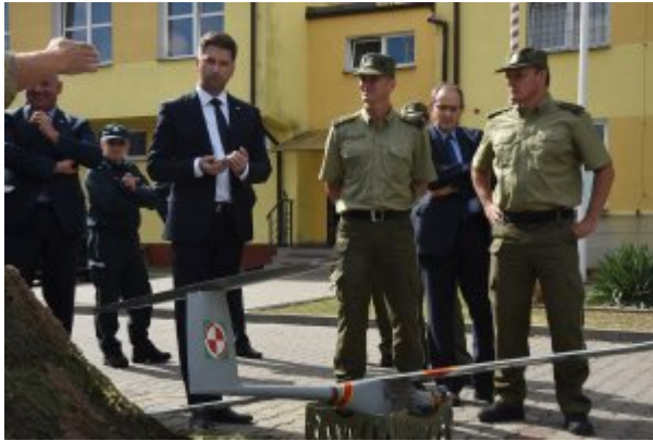
Wizyta Wiceministra MSWiA w Nadbużańskim OSG