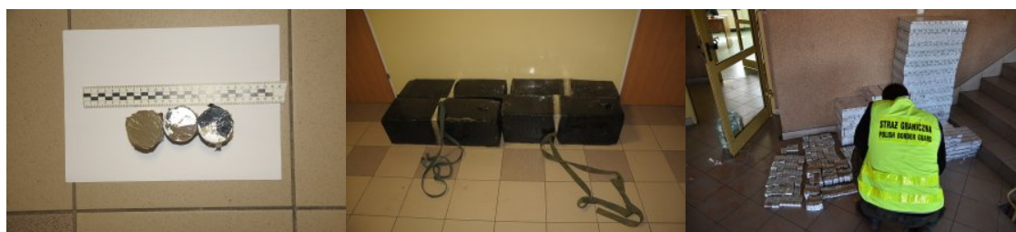
Magnesy za pomocą których przymocowano papierosy do wagonów kolejowych

24 września br., funkcjonariusze Straży Granicznej oraz Służby Celno - Skarbowej z Hrubieszowa prowadzili wspólne działania ukierunkowane na walkę z przemytem wyrobów akcyzowych. W ich trakcie, mundurowi obu służb zatrzymali na gorącym uczynku mężczyznę, który w kolejowym przejściu granicznym w Hrubieszowie, wyjmował z podwozi wagonów kolejowych pudła wypełnione papierosami. Zatrzymanym okazał się być 42 - letni obywatel Ukrainy, przy którym ujawniono wyroby akcyzowe bez polskich znaków akcyzy. Jak się okazało pakunki z papierosami były przymocowane do platformy wagonów przy pomocy magnesów, co ułatwiło cudzoziemcowi szybki ich demontaż.