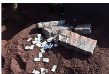
Zabezpieczanie papierosów pochodzących z przemytu.