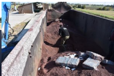
Zabezpieczanie papierosów pochodzących z przemytu.