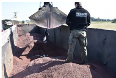
Zabezpieczanie papierosów pochodzących z przemytu.

znaków akcyzy w ilości ponad 5 tys. paczek. Papierosy ukryte były tym razem pod warstwą rudy żelaza przewożonej w pociągu towarowym z Ukrainy do Polski. Aby dostać się do ukrytych pakunków z papierosami funkcjonariusze musieli użyć do tego celu koparki.