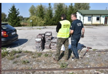
Zabezpieczanie papierosów pochodzących z przemytu.

Wartość zatrzymanego towaru wyniosła w tym przypadku prawie 70 tys. zł. Obecnie trwa ustalanie organizatorów tego przemytu.