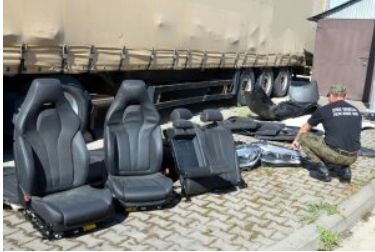
Ujawnione nielegalne podzespoły samochodowe

Oddziału SG, odzyskali blisko 1,5 tys. podzespołów samochodowych o wartości prawie 6 mln zł. Wartość odzyskanych części wzrosła aż o 68 procent, w stosunku do analogicznego okresu roku ubiegłego.