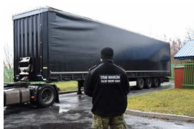
Toyota oraz naczepa

Tego samego dnia, tym razem na terenie drogowego przejścia granicznego w Kukurykach, odzyskano pochodzącą z przestępstwa naczepę samochodową. Tu do odprawy granicznej na kierunku wyjazdowym, stawił obywatel Białorusi, podróżujący samochodem ciężarowym Volvo z naczepą Krone. Podczas odprawy granicznej, funkcjonariusze ustalili, iż naczepa tego zestawu ciężarowego, ma przerobiony numer VIN. Kierowca został zatrzymany, zaś naczepę o wartości około 20 tys. zł zabezpieczono.