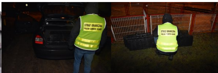
Zabezpieczanie papierosów pochodzących z przemytu