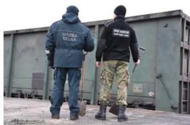
Zabezpieczanie papierosów pochodzących z przemytu

29 stycznia br., funkcjonariusze Straży Granicznej z Hrubieszowa prowadzili wspólne działania z funkcjonariuszami z wydziału operacyjno – śledczego NOSG oraz służby celno-skarbowej. Podczas tej wspólnie prowadzonej służby, funkcjonariusze monitorowali przejazd pociągu towarowego, który wjechał z terytorium Ukrainy do Polski. Okazało się, iż działania mundurowych wymierzone w przestępczość graniczną przyniosły dość szybko zamierzony efekt. W pobliżu miejscowości Jarosławiec w powiecie zamojskim, funkcjonariusze zatrzymali czterech mężczyzn. Obywatel Polski oraz trzech obywateli Ukrainy, wyrzucali z jadącego pociągu nielegalne papierosy pochodzące z przemytu. Kontrabanda została załadowana do ładunku rudy żelaza jeszcze na terytorium Ukrainy. Mężczyźni wykorzystując moment, w którym pociąg zwalniał przy przejeździe kolejowym, weszli na jadące wagony składu. Po wydobyciu pakietów z nielegalnymi papierosami, wyrzucali je wzdłuż linii kolejowej. Funkcjonariusze zatrzymali całą czwórkę w momencie ładowania kontrabandy do samochodu. Na miejscu, zabezpieczono ponad 14 tys. paczek papierosów bez polskich oznaczeń akcyzy o wartości prawie 200 tys. zł. Papierosy były spakowane w kartonowe pudła i owinięte czarną folią.