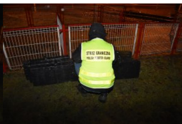
Zabezpieczanie papierosów pochodzących z przemytu