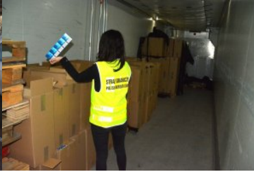
Nadbużański Oddział Straży Granicznej - podsumowano 2019 rok