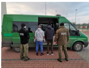
Nadbużański Oddział Straży Granicznej - podsumowano 2019 rok

W NOSG, dokonano prawie 500 kontroli legalności zatrudnienia, które objęły ponad 11 tys. cudzoziemców. W wyniku tych działań ponad 300 cudzoziemców zostało zobowiązanych do opuszczenia terytorium Polski, wobec 432 nielegalnych pracowników z zagranicy skierowano wnioski do Sądu o ukaranie. Kontrole legalności spowodowały również skierowaniem do sądu wniosków o ukaranie wobec 160 pracodawców, którzy nielegalnie zatrudniali obcokrajowców.