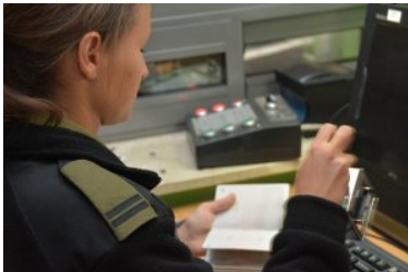
Nadbużański Oddział Straży Granicznej - podsumowano 2019 rok

Funkcjonariusze z Nadbużańskiego Oddziału Straży Granicznej, w swej codziennej służbie, podczas prowadzonych kontroli granicznych, ujawnili w minionym roku 777 fałszerstw różnych dokumentów przedstawianych do kontroli. Najczęściej fałszowane są: „Oświadczenia o zamiarze powierzenia pracy.....”, paszporty, wize, dowody rejestracyjne pojazdów, polisy ubezpieczeniowe, zezwolenia na pobyt oraz prawa jazdy.