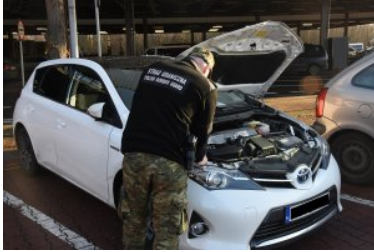
Nadbużański Oddział Straży Granicznej - podsumowano 2019 rok