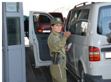
Nadbużański Oddział Straży Granicznej – podsumowano 2019 rok

W 2019 roku funkcjonariusze z Nadbużańskiego Oddziału SG odprawili w przejściach granicznych ponad 4 mln środków transportu i ponad 13 mln osób.