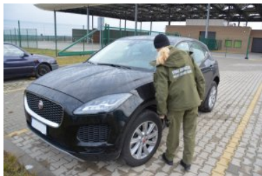
Zabezpieczanie odzyskanych pojazdów

19 lutego br., funkcjonariusze z Placówki SG z Dołhobyczowa, podczas działań kontrolnych prowadzonych na parkingach w pobliżu drogowego przejścia granicznego w Dołhobyczowie, odzyskali luksusowego Jaguara F-Pace. Jak ustalili funkcjonariusze, SUV ten był poszukiwany jako utracony na terytorium Włoch. Auto, którego wartość została oszacowana na około 270 tys. zł, zostało zabezpieczone na parkingu służbowym SG. W sprawie wszczęto postępowanie przygotowawcze dotyczące paserstwa.