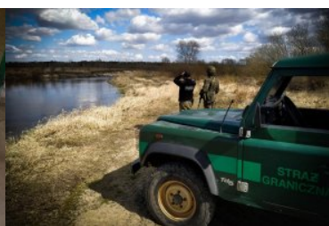
Ujawnione nielegalne papierosy

Zatrzymani mieszkańcy Chełma odpowiedzą teraz za przestępstwo skarbowe.