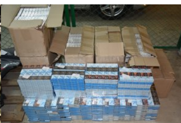
Ujawnione nielegalne papierosy