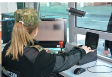
Trwa nabór do służby w Nadbużańskim Oddziale SG

Dbając o bezpieczeństwo Państwa oraz funkcjonariuszy i pracowników Straży Granicznej, każdy kandydat, przebywający na terenie obiektów Straży Granicznej zobowiązany jest do posiadania maseczki ochronnej zasłaniającej usta i nos. Dodatkowo należy posiadać własne przybory do pisania.