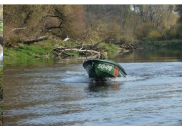
Trwa nabór do służby w Nadbużańskim Oddziale SG