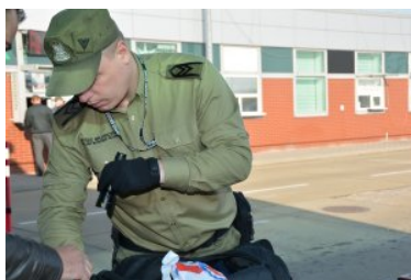
Trwa nabór do służby w Nadbużańskim Oddziale SG