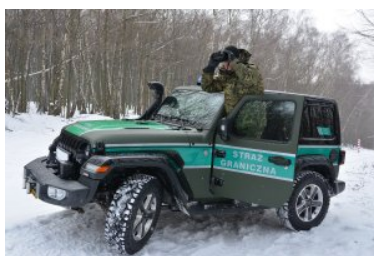
Trwa nabór do służby w Nadbużańskim Oddziale SG

Dokumenty od kandydatów przyjmowane będą po wcześniejszym wyznaczeniu terminu i konkretnej godziny do ich złożenia. Zapisy kandydatów zainteresowanych złożeniem dokumentów odbywać się będą od poniedziałku do piątku w godz. 8.00-15.00 pod nr tel. 82-568 50 92 lub 797 337 619.