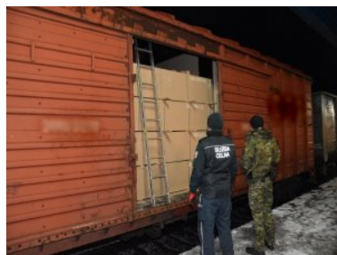
Zabezpieczanie papierosów pochodzących z przemytu

Funkcjonariusze obu służb wykryli przemyt podczas wspólnej kontroli pociągu towarowego wjeżdżającego z Białorusi do Polski. Towarowy skład przewoził m.in. ładunek płyty pilśniowej. I to właśnie w jednym z wagonów z płytą mundurowi znaleźli również wyroby tytoniowe. Owinięte folią pakiety z papierosami poukładane były na towarze legalnie wwożonym do Polski.