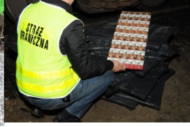
Zabezpieczanie papierosów pochodzących z przemytu

Przeprowadzone w ramach śledztwa czynności wykazały, że działalność przemytników polegała na wykorzystywaniu konstrukcji wagonów pociągów towarowych, w których ukrywane były papierosy bez polskich znaków skarbowych akcyzy.