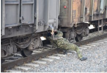
Zabezpieczanie papierosów pochodzących z przemytu