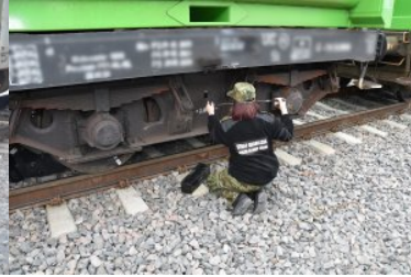
Zabezpieczanie papierosów pochodzących z przemytu