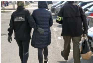
Straż Graniczna rozbiła zorganizowaną grupę przestępczą

Do rozbicia zorganizowanej grupy przestępczej i zatrzymania 8 osób – obywateli Ukrainy, doszło w ubiegłym tygodniu (20 i 21.04.2021 r.) na terenie Warszawy, Łodzi i Bydgoszczy, dzięki szeroko zakrojonej współpracy funkcjonariuszy z placówek Straży Granicznej: w Dołhobyczowie oraz w Łodzi.