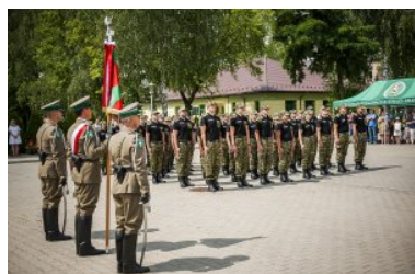
Ślubowanie nowo przyjętych funkcjonariuszy NOSG