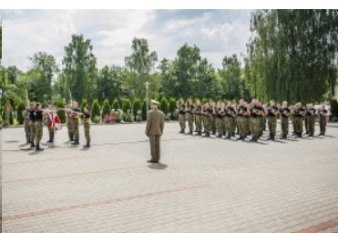
Ślubowanie nowo przyjętych funkcjonariuszy NOSG