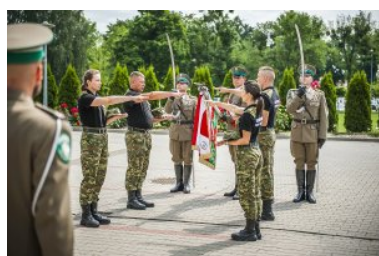
Ślubowanie nowo przyjętych funkcjonariuszy NOSG