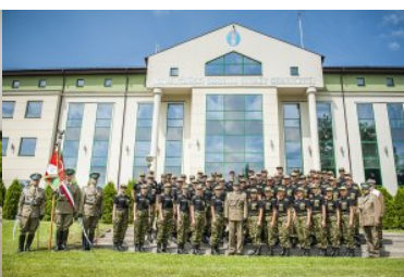
Ślubowanie nowo przyjętych