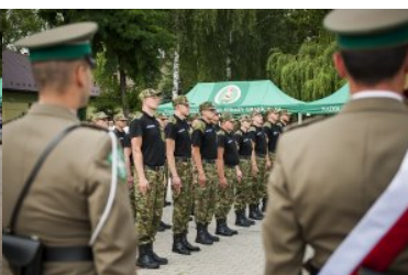
Ślubowanie nowo przyjętych funkcjonariuszy NOSG