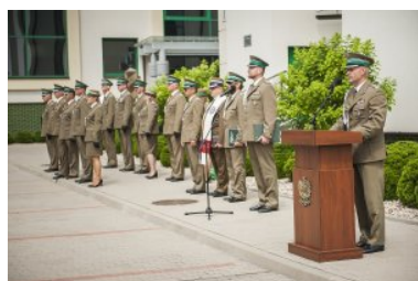
Ślubowanie nowo przyjętych