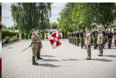
Ślubowanie nowo przyjętych funkcjonariuszy NOSG