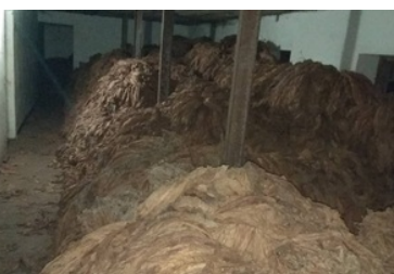
Zatrzymania i likwidacja grupy przestępczej zajmującej się nielegalną dystrybucją hurtowych ilości wyrobów akcyzowych w postaci suszu tytoniowego i krajanki