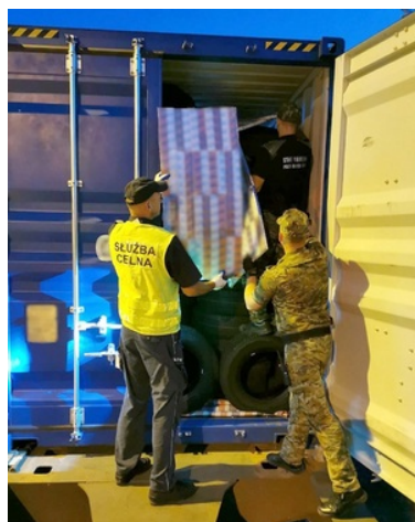
Zabezpieczanie papierosów pochodzących z przemytu

Do zdarzenia doszło w minioną sobotę 20 sierpnia br. Tego dnia, podczas kontroli pociągu towarowego jadącego z Brześcia do Małaszewicz, funkcjonariusze Nadbużańskiego Oddziału Straży Granicznej z Terespoli oraz lubelskiej Służby Celno-Skarbowej wykryli 4,4 tys. paczek papierosów. Nielegalne wyroby ukryte były w kontenerze pomiędzy ładunkiem opon samochodowych.