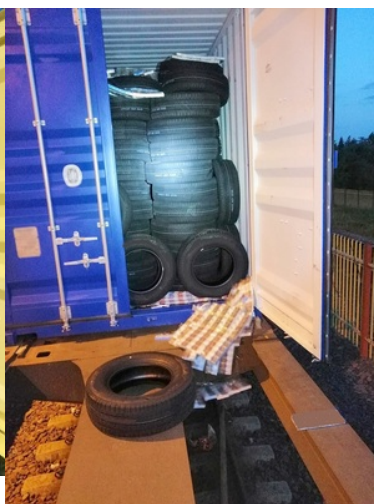
Zabezpieczanie papierosów pochodzących z przemytu

Rynkowa wartość zatrzymanych przez SG i KAS papierosów to blisko 65 tys. złotych.