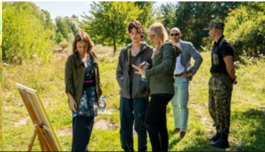
Plener malarski „U progu Niepodległej” nad Bugiem