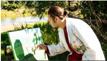
Plener malarski „U progu Niepodległej” nad Bugiem