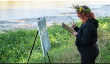
Plener malarski „U progu Niepodległej” nad Bugiem