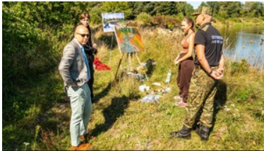
Plener malarski „U progu Niepodległej” nad Bugiem