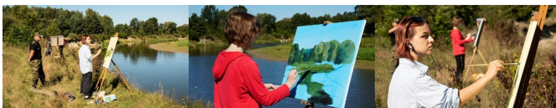
Plener malarski „U progu Niepodległej” nad Bugiem