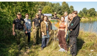
Plener malarski „U progu Niepodległej” nad Bugiem

Wernisaż prac uczniów odbędzie się w lubelskim Oddziale IPN w dniu 29 września, podczas konferencji popularnonaukowej organizowanej w ramach obchodów 83. rocznicy bitwy pod Wytycznem. Wspólne przedsięwzięcie edukacyjne IPN i NOSG stanowić ma atrakcyjną formę popularyzacji wiedzy o polskich formacjach granicznych oraz służby w Straży Granicznej.