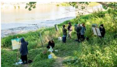
Plener malarski „U progu Niepodległej” nad Bugiem