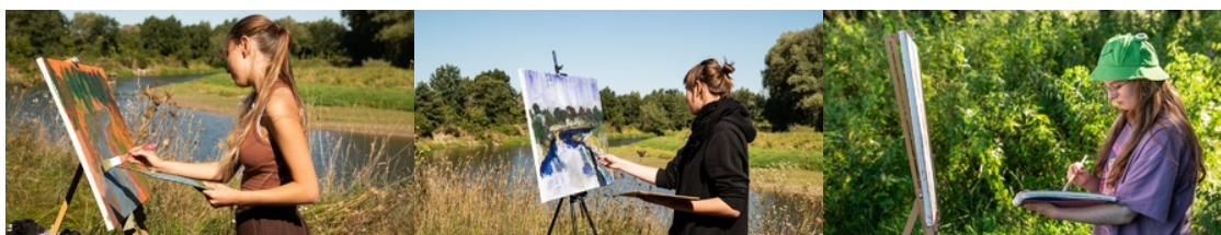
Plener malarski „U progu Niepodległej” nad Bugiem