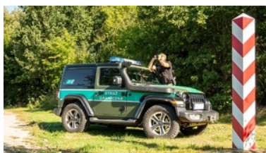
Zostań funkcjonariuszem Straży Granicznej

Istnieje też możliwość umówienia terminu złożenia wymaganych dokumentów za pośrednictwem poczty elektronicznej (w treści e-maila należy podać imię i nazwisko tylko jednego kandydata oraz nr telefonu): nabor.nadbuzanski@strazgraniczna.pl .