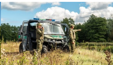
Zostań funkcjonariuszem Straży Granicznej