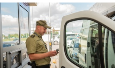
Zostań funkcjonariuszem Straży Granicznej