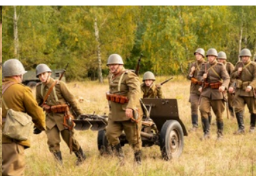
Uroczyste obchody 83. rocznicy bitwy pod Wytycznem