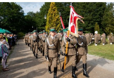
Uroczyste obchody 83. rocznicy bitwy pod Wytycznem