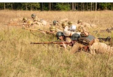
Uroczyste obchody 83. rocznicy bitwy pod Wytycznem