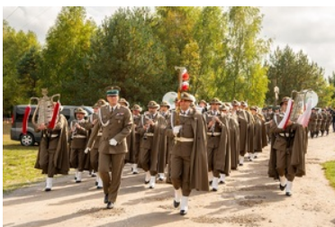
Uroczyste obchody 83. rocznicy bitwy pod Wytycznem

Na uroczystości obecni byli przedstawiciele władz wojewódzkich, samorządowych, służb mundurowych województwa lubelskiego, kombatanci a także mieszkańcy okolicznych miejscowości. Po odczytaniu Apelu Poległych i modlitwie ekumenicznej, złożono wieńce na grobach poległych żołnierzy.