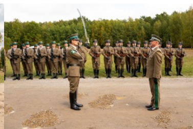
Uroczyste obchody 83. rocznicy bitwy pod Wytycznem