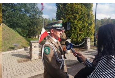
Uroczyste obchody 83. rocznicy