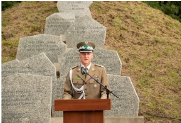
Uroczyste obchody 83. rocznicy bitwy pod Wytycznem