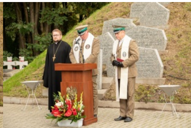
Uroczyste obchody 83. rocznicy bitwy pod Wytycznem