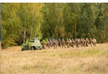
Uroczyste obchody 83. rocznicy bitwy pod Wytycznem