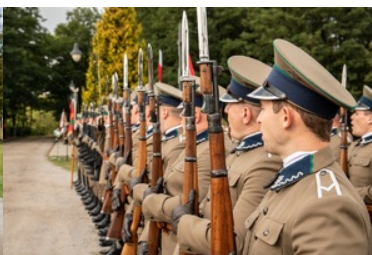
Uroczyste obchody 83. rocznicy bitwy pod Wytycznem