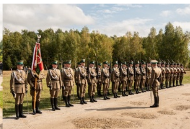
Uroczyste obchody 83. rocznicy bitwy pod Wytycznem