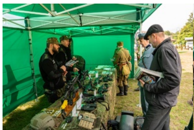
Uroczyste obchody 83. rocznicy bitwy pod Wytycznem