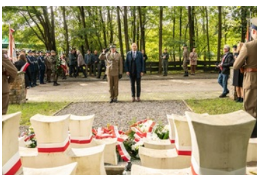
Uroczyste obchody 83. rocznicy