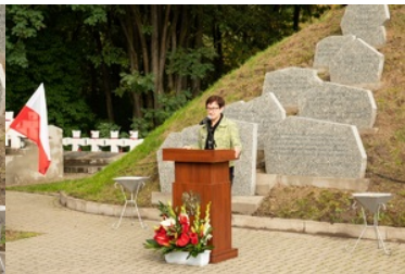
Uroczyste obchody 83. rocznicy bitwy pod Wytycznem