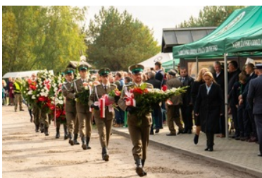
Uroczyste obchody 83. rocznicy bitwy pod Wytycznem