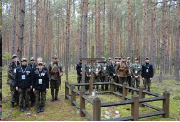
Uroczyste obchody 83. rocznicy bitwy pod Wytycznem