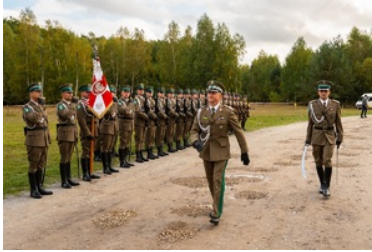
Uroczyste obchody 83. rocznicy bitwy pod Wytycznem