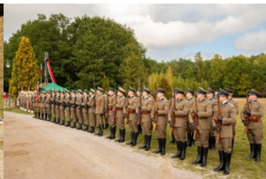
Uroczyste obchody 83. rocznicy bitwy pod Wytycznem