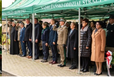
Uroczyste obchody 83. rocznicy bitwy pod Wytycznem