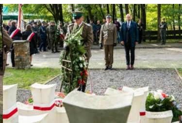
Uroczyste obchody 83. rocznicy bitwy pod Wytycznem