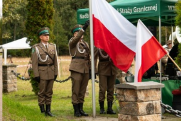
Uroczyste obchody 83. rocznicy bitwy pod Wytycznem