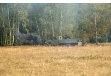
Uroczyste obchody 83. rocznicy bitwy pod Wytycznem