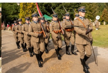
Uroczyste obchody 83. rocznicy