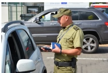
służba w Nadbużańskim Oddziale Straży Granicznej

W naszej formacji możesz z powodzeniem łączyć przyjemne z pożytecznym, rozwijając swoje pasje i zainteresowania. Służba w Nadbużańskim Oddziale Straży Granicznej to codziennie nowe wyzwania! Może czekamy właśnie na Ciebie?