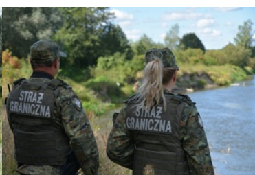
służba w Nadbużańskim Oddziale Straży Granicznej