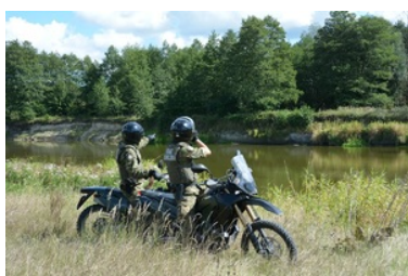
służba w Nadbużańskim Oddziale Straży Granicznej