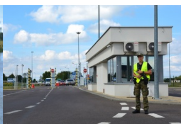
służba w Nadbużańskim Oddziale Straży Granicznej