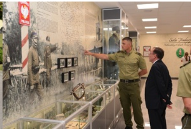
Szef MSWiA w towarzystwie funkcjonariuszy SG zwiedza Salę Tradycji w NOSG