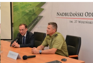
Szef MSWiA uczestniczy w odprawie służbowej w NOSG

Wizyta ministra MSWiA w Nadbużańskim Oddziale SG, była również okazją do zapoznania się z infrastrukturą samego oddziału jak i odwiedzenia Sali Tradycji NOSG, przy której