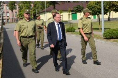
Minister MSWiA zapoznaje się z infrastrukturą obiektów na terenie NOSG