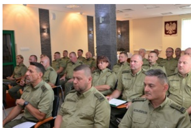
Funkcjonariusze NOSG uczestniczą w odprawie służbowej