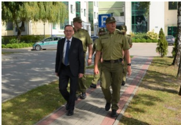
Minister MSWiA zapoznaje się z infrastrukturą obiektów na terenie NOSG

funkcjonuje Przystanek Historia Chełm. Jest on jednym z trzech punktów na mapie Lubelszczyzny, poświęconych promowaniu edukacji historycznej.