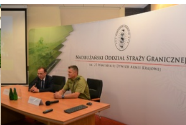
Szef MSWiA uczestniczy w odprawie służbowej w NOSG