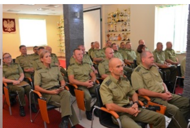
Funkcjonariusze NOSG uczestniczą w odprawie służbowej