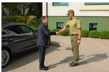
Powitanie ministra MSWiA przez komendanta NOSG

Minister Mariusz Kamiński podczas roboczego spotkania z kadrą kierowniczą NOSG zapoznał się z aktualną sytuacją w ochronie granicy państwowej. Szef MSWiA podczas spotkania podziękował funkcjonariuszom za profesjonalnie realizowaną codzienną służbę i skuteczną ochronę granicy państwowej.