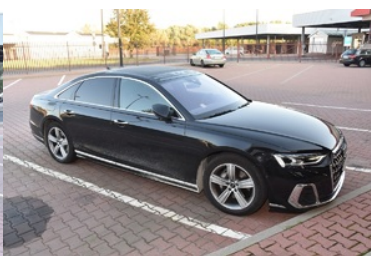
Odzyskany przez funkcjonariuszy NOSG samochód osobowy marki Audi A8, na terenie drogowego przejścia granicznego w Terespolu

Kierowcę wraz z pojazdem przekazano do dalszych czynności funkcjonariuszom Policji z Terespolu.