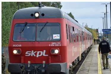
Widok na kolejowe przejście graniczne w Hrebennem

Ruch w kolejowym przejściu granicznym w Hrebennem, był zawieszony od 2005 roku. Przewoźnik poinformował, iż przewozy są realizowane 3-wagonowym szynobusem spalinowym SN84 posiadającym 210 miejsc siedzących. Odprawa graniczna jest prowadzona przez służby graniczne w pociągu na stacji Hrebennie. Podczas pierwszej odprawy w minioną niedzielę (15 października) funkcjonariusze Nadbużańskiego Oddziału Straży Granicznej z Hrebennego odprawili 201 podróżnych.