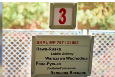
Karta informacyjna dotycząca realizowanego połączenia kolejowego