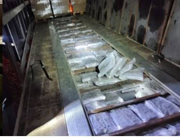
Funkcjonariusze SG, KAS oraz Policji zabezpieczają ujawnione narkotyki