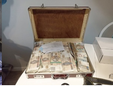
Zabezpieczone środki finansowe

Obu zatrzymanych mężczyzn doprowadzono do Prokuratury Krajowej w Lublinie Wydziału Departamentu do Spraw Przeszeczności Zorganizowanej i Korupcji, gdzie usłyszeli oni zarzut wewnątrzspółnotowego nabycia na terenie UE i przewozu znacznych ilości środków odurzających tj. o czyn z art. 55 ust. 3 Ustawy z dnia 29.07.2002 roku z późni. zm. o przeciwdziałaniu narkomanii, za co grozi im kara pozbawienia wolności od lat 3 do 20.