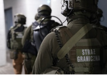
Funkcjonariusze NOSG dokonują czynności związanych z zatrzymaniem osób o udział w zorganizowanej grupie przestępczej