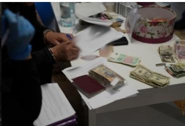
Funkcjonariusze NOSG dokonują czynności związanych z zatrzymaniem osób o udział w zorganizowanej grupie przestępczej

Aktualnie w toku postępowania Lubelskiego Wydziału Zamiejscowego Departamentu do Spraw Przestępczości Zorganizowanej i Korupcji Prokuratury Krajowej w Lublinie jest 32 podejrzanych, w tym m.in. obywatele Polski, Ukrainy, Syrii, Iraku, Turcji i Gruzji. Postępowanie, w które zaangażowane zostały służby z Polski, Litwy oraz Niemiec prowadzone jest przy ścisłej współpracy z Eurojustem i Europol.