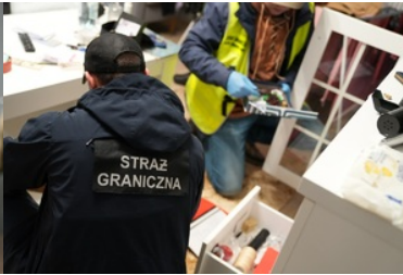
Funkcjonariusze NOSG dokonują czynności związanych z zatrzymaniem osób o udział w zorganizowanej grupie przestępczej