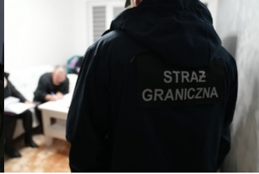
Funkcjonariusze NOSG dokonują czynności związanych z zatrzymaniem osób o udział w zorganizowanej grupie przestępczej