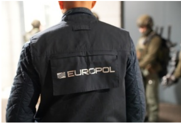
Funkcjonariusze NOSG dokonują czynności związanych z zatrzymaniem osób o udział w zorganizowanej grupie przestępczej