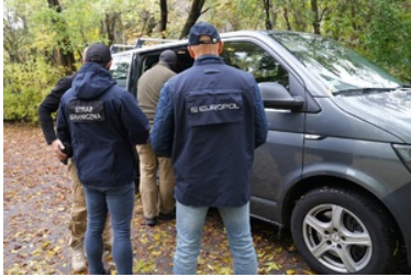
Funkcjonariusze NOSG dokonują czynności związanych z zatrzymaniem osób o udział w zorganizowanej grupie przestępczej