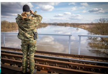
Funkcjonariusze NOSG podczas realizacji czynności związanych z ochroną granicy państwowej