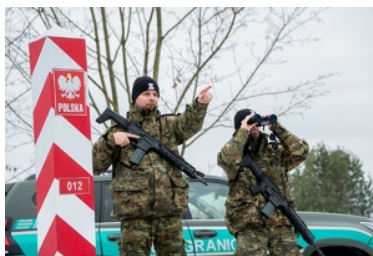
Funkcjonariusze NOSG podczas realizacji czynności związanych z ochroną granicy państwowej

Istnieje też możliwość umówienia terminu złożenia wymaganych dokumentów za pośrednictwem poczty elektronicznej (w treści e-maila należy podać imię i nazwisko tylko jednego kandydata oraz nr telefonu).