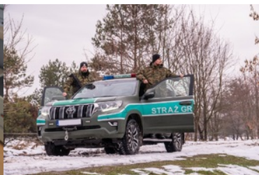
Funkcjonariusze NOSG podczas realizacji czynności związanych z ochroną granicy państwowej

Nadbużański Oddział Straży Granicznej ochrania odcinek granicy państwowej o długości 467, 57 km., obejmując strefę swego działania obszar woj. lubelskiego. Służbę pełni tu około 3 tysięcy funkcjonariuszy i pracowników, którzy na co dzień zaangażowani są ochroną granicy z Republiką Białorusi i z Ukrainą. Ustawowe zadania oddział realizuje siłami 20 placówek: 7 na granicy z Białorusią, 11 na granicy z Ukrainą oraz 2 realizującymi zadania w głębi kraju.