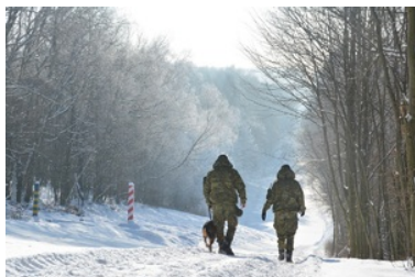
Funkcjonariusze NOSG podczas realizacji czynności związanych z ochroną granicy państwowej

https://www.nadbuzanski.strazgraniczna.pl/nos/praca/funkcjonariusze/17203,Wznowiono-rekrutacje-do-sluzby-w-Nadbuzanskim-Oddziale-Strazy-Granicznej.html