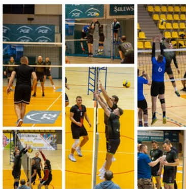
Funkcjonariusze NOSG zegrali dla WOSP w turnieju siatkówki