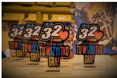
Statuetki dla zwycięzców turnieju