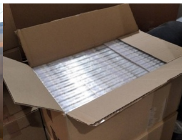
Zabezpieczanie nielegalnych papierosów przez funkcjonariuszy podczas prowadzonych działań