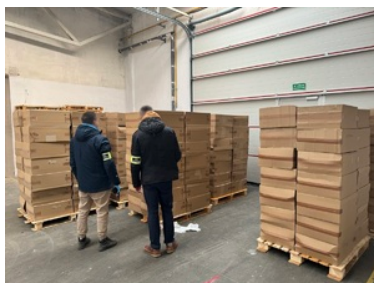
Zabezpieczanie nielegalnych papierosów przez funkcjonariuszy podczas prowadzonych działań

Funkcjonariusze NOSG z Placówki w Hrebennem oraz z KAS i CBŚP, w przeciągu 24 h przeszukali kilka lokalizacji na terenie woj. łódzkiego. Zlikwidowali dwa magazyny z papierosami bez polskich znaków akcyzy. Nielegalne wyroby akcyzowe znaleźli również w budynku gospodarczym, samochodach i na naczepie samochodu ciężarowego. Podczas prowadzonych działań zatrzymano 3 mężczyzn. Gdyby papierosy i tytoń trafiły do sprzedaży, straty budżetu państwa wyniosłyby blisko 12 mln zł.