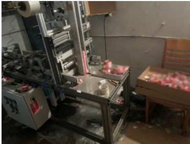
Zabezpieczona maszyna do produkcji nielegalnych papierosów

Dwóm zatrzymanym mężczyznom postawiono już zarzuty paserstwa akcyzowego. Grożą im wysokie grzywny.