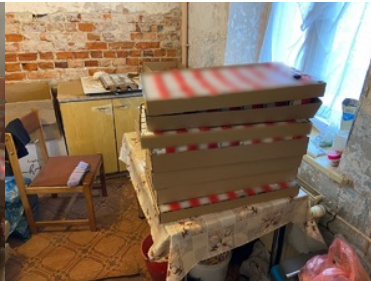
Zabezpieczone nielegalne papierosy spakowane w płaskie pudełka