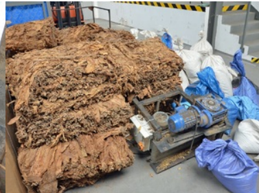
Zabezpieczony susz tytoniowy