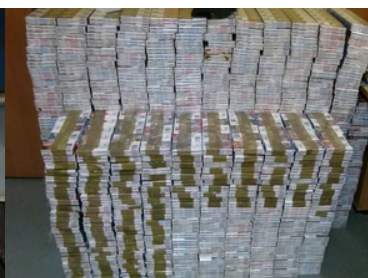
Zabezpieczony ładunek nielegalnych papierosów ujawnionych w składzie kolejowym