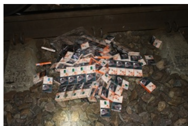
Ujawnione nielegalne papierosy przewożone koleją

Dalsze postępowania w sprawach prowadzi Lubelski Urząd Celno-Skarbowy w Białej Podlaskiej.