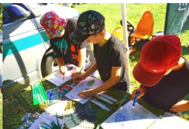
Atrakcje przygotowane przez funkcjonariuszy