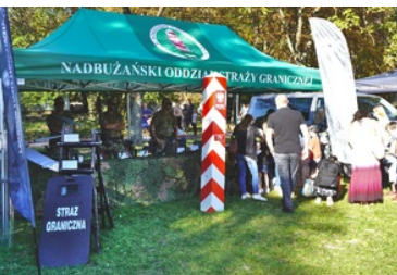
Stoisko promocyjne NOSG