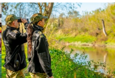
Trwa rekrutacja do służby w Nadbuzańskim Oddziale Straży Granicznej