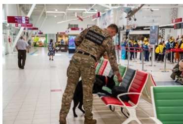
Trwa rekrutacja do służby w Nadbuzańskim Oddziale Straży Granicznej