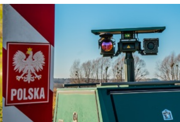
Trwa rekrutacja do służby w Nadbuzańskim Oddziale Straży Granicznej