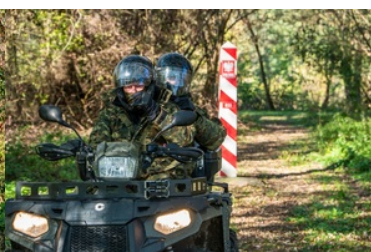
Trwa rekrutacja do służby w Nadbuzańskim Oddziale Straży Granicznej