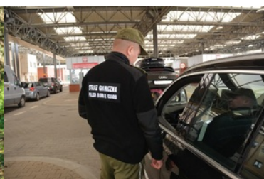
Trwa rekrutacja do służby w Nadbuzańskim Oddziale Straży Granicznej