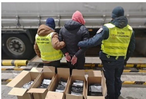
Funkcjonariusze SG i KAS z zatrzymanym obywatelem Białorusi

Zatrzymany mężczyzna w Prokuraturze Rejonowej w Suwałkach usłyszał zarzut przewozu znacznych ilości narkotyków. Decyzją sądu, zastosowano areszt tymczasowy na okres 3 miesięcy. Grozi mu kara grzywny i pozbawienia wolności od 3 do 20 lat. Sprawę prowadzi Nadbużański Oddział Straży Granicznej pod nadzorem Prokuratury Rejonowej w Suwałkach.