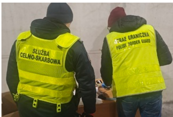
Funkcjonariusze SG i KAS