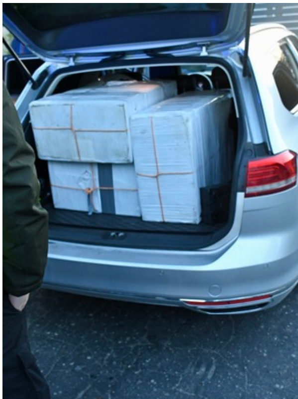
SG i KAS i rozbiły grupę przestępczą, która przemycała papierosy za pomocą balonów meteorologicznych