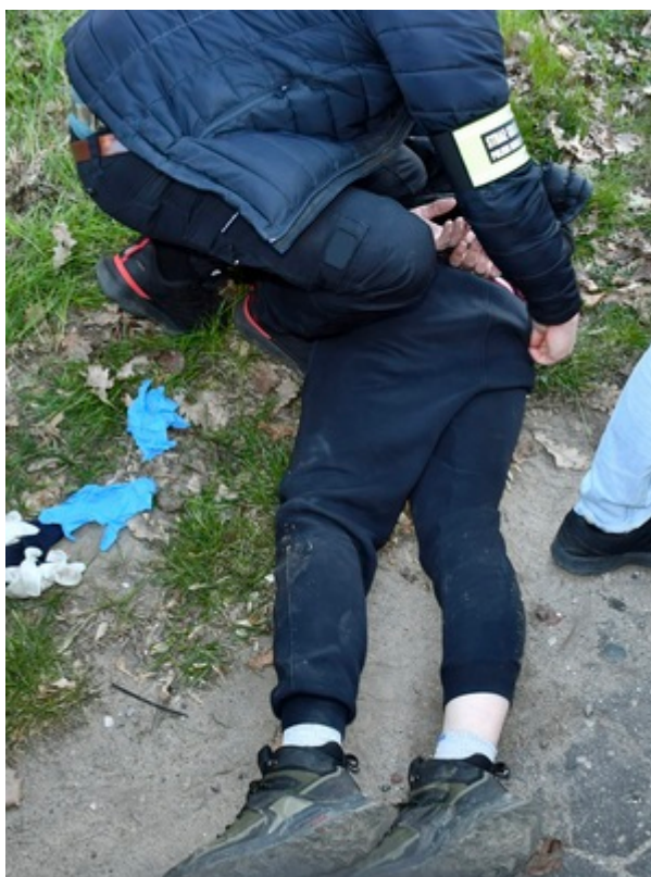
SG i KAS i rozbiły grupę przestępczą, która przemycała papierosy za pomocą balonów meteorologicznych