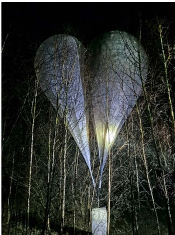
SG i KAS i rozbiły grupę przestępczą, która przemycała papierosy za pomocą balonów meteorologicznych