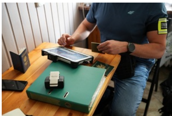
Kontrola legalności pobytu