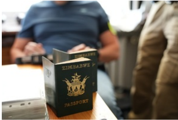
Kontrola legalności pobytu